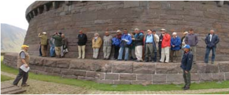
Deutscher Kriegsfriedhof am Passo Pordoi

eine ganze Serie von Grenzfestungen, die aber 1914 bereits veraltet waren und den neuen brisanten Artilleriegeschossen nicht standhielten. Dazu gehört auch die in ein Hotel umfunktionierte Festung Ruaz unterhalb des Col di Lana.