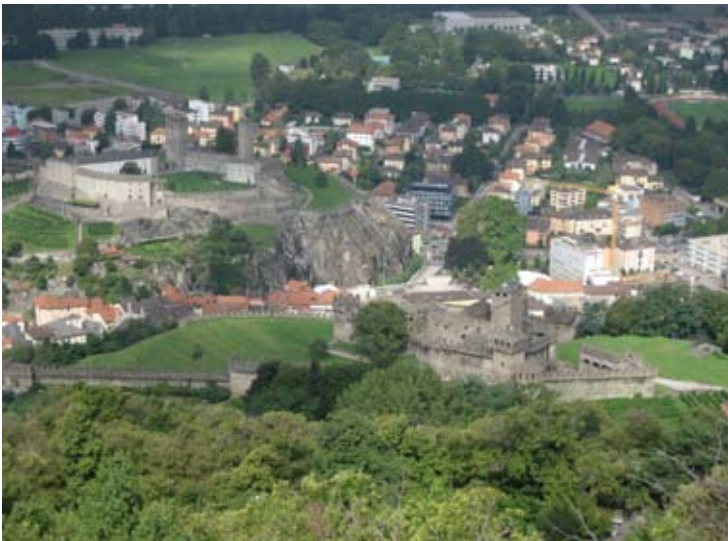
Blick auf die Castelli Grande (UR) und Montebello (SZ) vom Sasso Corbaro (NW/OW) aus

(der «Schweine-Tinnes») und ein Gnadestuhl, der etwas an Masaccio erinnert. Zweifach wird der Pest-Heilige St. Sebastian dargestellt (doppelt genäht ...). Danach Fahrt zur kleinen Kirche von Artore , wo sich ein prächtiges Panorama vom Lago Maggiore bis ins Misoix, bzw. in die Riviera darbot und man die ehemaligen Vogteisitze der Innerschweizer Orte, die Castelli Grande (Uri) und Montebello (Schwyz) mit der Talsperre (Murata) aus der Vogelschau betrachten konnte. Hier wurden die geschichtlichen Ereignisse, angefangen vom Neolithikum über die Römer (Belitionis Castrum), die Völkerwanderungszeit, die Machtkämpfe zwischen Mailand und Como mit den guelfischen und ghibellinnischen Auseinandersetzungen, die Besitznahme der 12 Orte bis zur Kantonsgründung durch Napoleon 1803 und anderes mehr, resümierend dargestellt. Unterstrichen wurde Bellenz' Bedeutung als Schlüsselstellung am Fuss wichtiger Alpenpässe. Besuch des Castello di Sasso Corbaro (Unterwalden). Reichliches und schmackhaftes