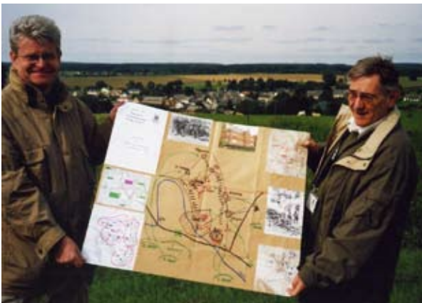
Der Endkampf der bei Sedan eingeschlossenen Franzosen in Jilly

Auf der Fahrt über Dijon nach Belfort erlebten wir noch die Gefechte der Vogesenarmee (Freikorps von Garibaldi) bei Dijon und das Schicksal der Bourbaki-Armee. Eindrücklich und