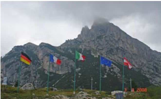
Passo Falzàrego, hinten der Hexenstein

nen (Martini-Stellung). Die direkt darüber liegenden Österreicher auf dem Lagazuogipfel konnten die Italiener nicht unter Feuer nehmen, und so beschlossen sie, mit einer gewaltigen Sprengung das vom Feind gehaltene Felsenband in die Luft zu sprengen und zuzuschütten. Am 22. Mai 1917 wurden mit 24 t Sprengstoff 130'000 m 3 Felsen gesprengt, die auf das Felsenband der Italiener stürzten. Die feindliche Stellung wurde schwer beschädigt, aber die Italiener konnten das Felsenband halten. Auch sie begannen mit dem Tunnelbau. Sie gruben von unten einen über 1'100 m langen steilen Stollen unter den von den Österreichern gehaltenen Lagazuoi-Vorgipfel, der seinerseits am 20. Juni 1917 mit 33 t Sprengstoff gesprengt wurde. Dieser Stollen wurde von unserer Gruppe mit Helm und Taschenlampe von oben nach unten begangen, ein abenteuerlicher Abstieg! Der Ausgang liegt etwa in halber Wandhöhe, von wo ein exponierter Felsenpfad hinunter auf den Falzàregopass führt. Auf dem Passo Valparola besuchten wir die österreichische Festung Tra i Sassi mit Kriegsmuseum. Nach dem Sieg von Österreich in Custoza 1866 wurde die italienisch-österreichische Grenze im Südtirol neu festgelegt. Österreich baute darauf