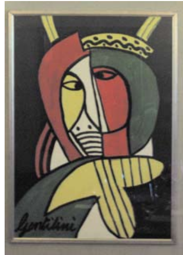
Nach dem zweiten Mal Tessiner Platte und Merlot (Bild bei «Delea»)