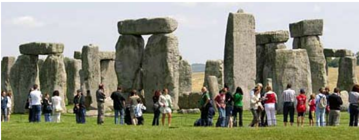
Das Weltkulturerbe Stonehenge bleibt rätselhaft und geheimnisvoll.

Aber Invasionen sind nicht nur den Römern und den Normannen zuzuschreiben. Noch weitere Völker sind – nach der römischen und vor der normannischen Invasion – auf die Insel eingedrungen. Die komplexe Staatenbildung der frühenglischen Geschichte widerspiegelt diesen Jahrhunderte dauernden Prozess. Erst sickerten die Angeln, Sachsen und Jüten vom südöstlich gelegenen europäischen Festland her ein, etwas später die dänischen Wikinger. An der Stadt Winchester lässt sich dies sehr schön ablesen. Zuerst eine frühe Siedlung der Briten, dann von den Römern zur Stadt erweitert, von den Sachsen zur Hauptstadt Englands erhoben, war sie Krönungsstadt von Alfred dem Grossen, der die Wikinger besiegte, und weiterer angelsächsischer Könige bis zu Wilhelm dem Eroberer. Von der normannischen Kathedrale ist nur noch der Grundriss sichtbar; die heutige Kathedrale stammt aus dem 11. Jh. Als besondere Kostbarkeit gilt die Winchester Bible, die wir in einem Seitenraum besichtigen konnten. Einen Zeitsprung zurück um rund 5000 Jahre brachte uns der Besuch von Stonehenge auf der weiten Ebene nördlich von Salisbury. Die Steinkreisanlage von frühestens 2400 v. Chr. zieht Besucher in Massen an. Ausgestattet mit Audioguides wandeln sie im Gegenuhrzeigersinn in sich gekehrt um das prähistorische Megalithbauwerk und versuchen die detaillierten Informationen aufzunehmen; fast zu