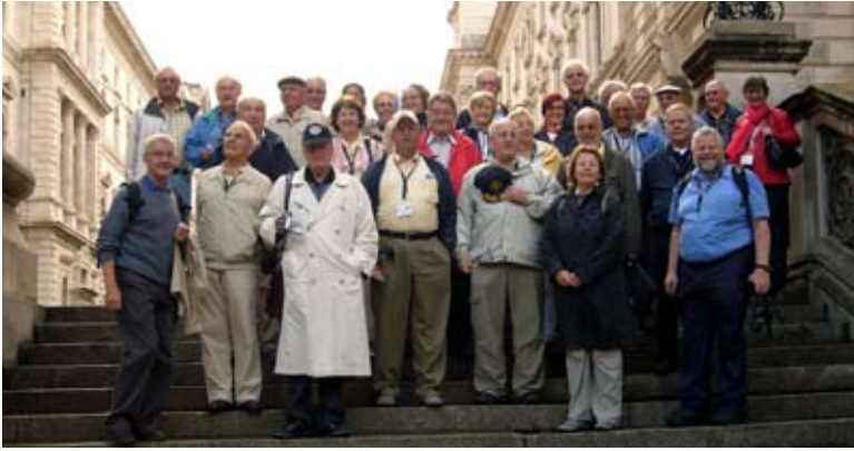
Unsere Reisegruppe beim Churchill Museum

viel wird vermittelt über Erbauer und Bauphasen, die Herkunft der Steine, die vermutete kultische Bedeutung, den möglichen Zusammenhang mit der Zeitmessung, die weiteren Baudenkmäler in der Umgebung – und am Ende bleiben doch Fragen über Fragen. Denn wir haben es mit einer schriftlosen Zeit zu tun und alle Erkenntnisse beruhen auf archäologischen und religionswissenschaftlichen Befunden.