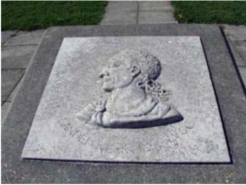
Gedenkstein für Caesar am Strand von Deal

Gezeitenunterschieden des Kanals nicht vertraut waren. Jedoch gelang ihnen die Landung zweimal; sie machten sich die Bevölkerung tributpflichtig und nahmen Geiseln. Wie lange die Zahlungen erfolgten, ist unbekannt; Caesar ist bekanntlich 44 v. Chr. ermordet worden. Offenbar ging aber in Rom das Wissen um das ferne Britannien nicht verloren. Fast 100 Jahre später, im Jahre 45 n. Chr., erfolgte die eigentliche Invasion, mit mehr Truppen, besseren Schiffen und nachhaltiger Wirkung: Rom blieb während der nächsten 400 Jahre die beherrschende Macht auf der Insel. Die keltische Urbevölkerung wurde nach Westen gedrängt oder aufgesogen – so genau weiss man das nicht, denn die Kelten haben keine Schriftzeugnisse hinterlassen. Jeden-