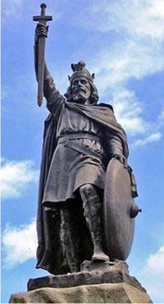
Denkmal Alfreds des Grossen in Winchester

eine andere Geschichte. Mit Audioguides versehen schwärmte die Reisegruppe aus, den kenntnisreichen Ausführungen an den verschiedenen Schauplätzen des Kampfgeschehens lauschend. Die normannische Invasion hat England umgekrempelt: Sie hat sich sowohl im Baustil wie in der Verwaltung (Domesday Book) niedergeschlagen und ist von nachhaltiger Wirkung geblieben.