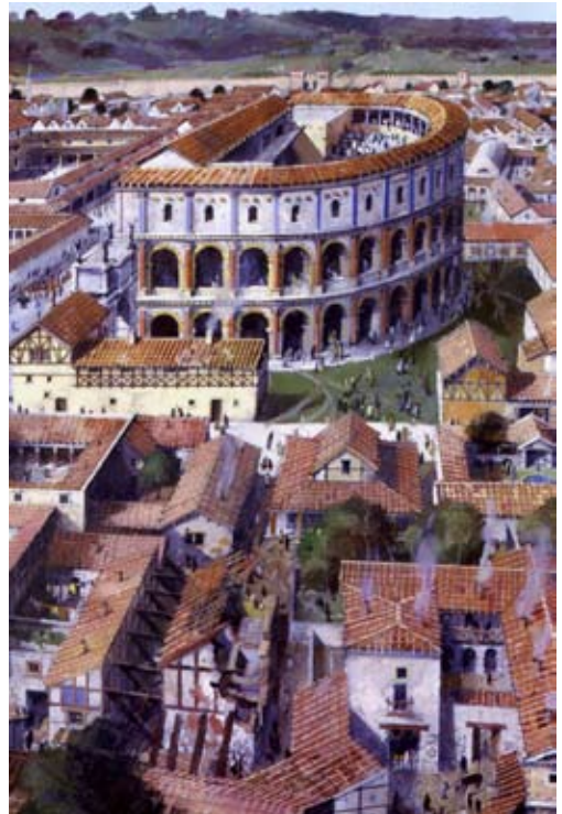
Das römische Canterbury

Bei freundlicherem Wetter konnte der kiesige Strand von Deal , zwischen Dover und Sandwich gelegen, begangen werden, wo 55 und 54 v. Chr. Caesar mit seinen Expeditionstruppen an Land gegangen war. Die Überfahrt aus der Gegend von Boulogne her war für die mittelmeergewohnten Römer nicht einfach, da sie mit den grossen