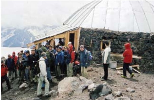
Blick von der Schutzhütte 11 auf 4200 m auf die Elbrus-Gipfel im Nebel (Aufnahme vom 30.7.2008)