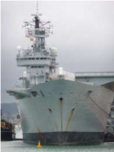
Der Flugzeugträger «Ark Royal»