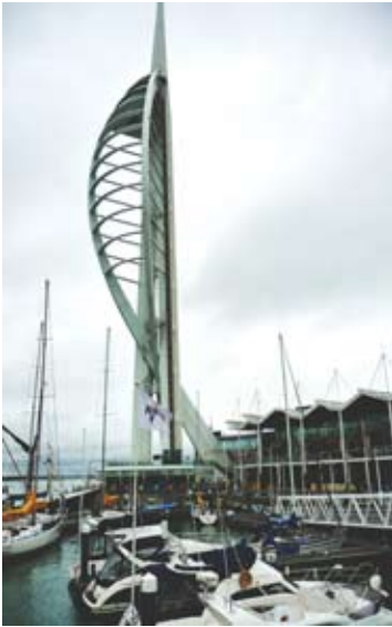
Der Spinakertower, das neue Wahrzeichen von Portsmouth

Die Stadt zählt knapp 200'000 Einwohner und ist seit frühester Zeit der Haupthafen der britischen Flotte. Sie verfügt über zahlreiche zivile und militärische Hafeneinrichtungen und ist der Ausgangspunkt für die Fährverbindungen zur vorgelagerten Isle of Wight, zu den Kanalinseln, nach Calais und bis nach Bilbao. Der vor kurzem erbaute über 100 m hohe Spinakertower, der dem Siebensternhotel Buri al Arab in Dubai gleicht, ist das neue Wahrzeichen der Stadt und ermöglicht eine prachtvolle Aussicht auf Hafen und Umgebung. In seiner darauf folgenden Lecture unterstrich Admiral Parry seinerseits mit echt britischem Humor die Bedeutung der Hafenstadt Portsmouth. Von hier aus war Nelson zur Schlacht von Trafalgar in See gestochen, von hier aus hatte General Eisenhower die Vorbereitungen und die Durchführung der Invasion in der Normandie geleitet, und von hier aus war die englische Flotte