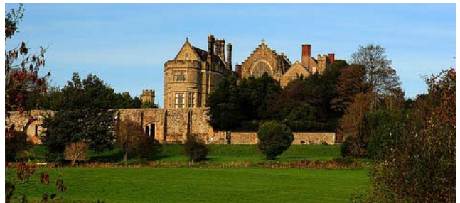
Das Gelände der Schlacht von 1066, im Hintergrund die Battle Abbey

Eine Invasion mit ebenso nachhaltiger Wirkung wie die römische setzte mit der Eroberung Britanniens durch die Normannen ein. In Battle, dem nach der Schlacht von 1066 bei Hastings benannten Ort, wo der siegreiche normannische Herzog Wilhelm den angelsächsischen König Harold besiegte, kann das Kampfgebiet besichtigt werden. Wilhelm hatte zum Gedenken an Harold ein Benediktinerkloster erbauen lassen, das über Jahrhunderte eine grosse Ausstrahlung entwickelte. Leider hat Heinrich VIII. die grossartige Anlage dann zerstören lassen – aber das ist