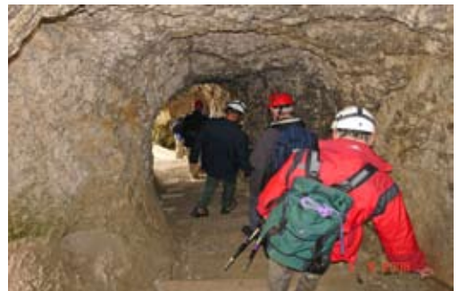
Abstieg durch den italienischen Stollen im Lagazuoi