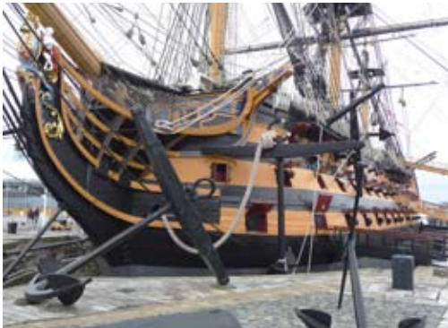
Admiral Nelsons Flaggschiff «Victory»