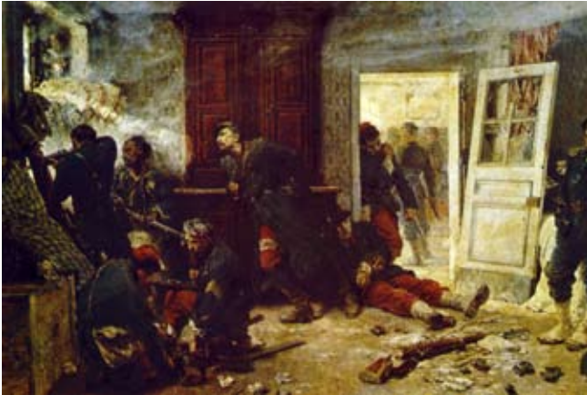
«La dernière cartouche», Bazeilles 1870 (Museum von Sedan).

landschaftlich reizvoll war die Fahrt entlang der Lisaine. Man gewann einen Eindruck, welchen Strapazen die kämpfende Infanterie bei Temperaturen bis -17 °C hier im offenen Gelände ausgesetzt war – durchaus verständlich, dass die Truppen von Bourbaki, die bekanntlich zum Teil aus Afrika stammten, nicht mehr bereit waren, unter diesen Umständen weiterzukämpfen. Zu erwähnen ist auch, dass wir auf der Reise verschiedene Kathedralen besichtigen konnten.