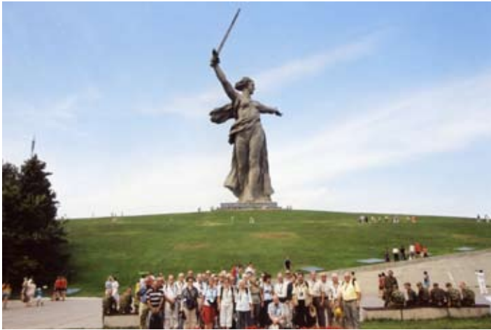
Die Reisegruppe auf dem Mamaihügel in Stalingrad

des Monats den grössten Teil der Stadt zu erobern. Doch die schon geschlagen geglaubte Rote Armee leistete Widerstand. Kurz nach der fast vollständigen deutschen Einnahme Stalingrads bündelte sie ihre überlegenen Kräfte westlich Stalingrads, um die deutschen Truppen in der Stadt einzukesseln. Nachdem Hitler einen Ausbruchversuch untersagt und eine Übergabe der Stadt abgelehnt hatte, ging die Rote Armee am 25. Januar 1943 dazu über, die Stadt zurückzuerobern; die 6. Armee wurde im Kessel von Stalingrad eingeschlossen und gefangen genommen.