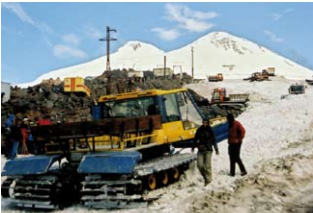
Wie es hätte sein können: Blick von der Schutzhütte 11 zu den Elbrus-Gipfeln (Aufnahme vom 7.8.2007)

gabung nicht abgesprochen werden. Jedenfalls wird wohl kein Teilnehmer je vergessen, dass Versorgungslinien wie Gummibänder gestreckt werden können, aber irgend einmal reissen, wenn sie überdehnt werden, und dass Angriffe aus der Tiefe des Raumes in die Tiefe des Gegners geführt werden, was auch für die beweglich zu führende Verteidigung gilt. Und was lässt Graf Tolstoi den Fürsten Kutusow, Generalfeldmarschall der russischen Armee und Held des Grossen Vaterländischen Krieges von 1812/1813 gegen Napoleon, zu seinem Zaren Alexander I. sagen?