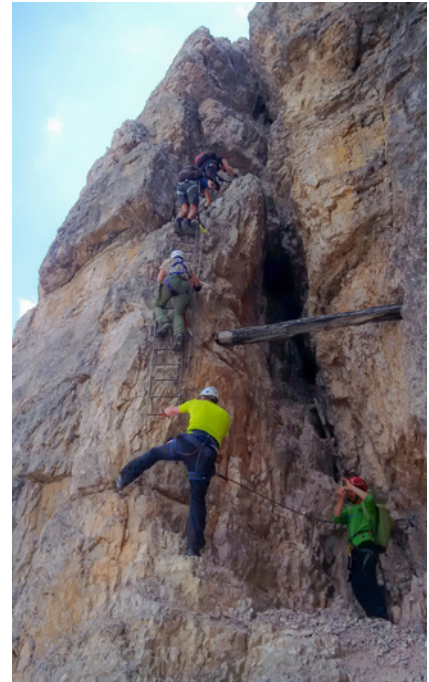
Leiternweg am Toblinger Knoten

W wie WLAN: wird vorausgesetzt, auch auf 2500 Metern. Wenn nicht vor-