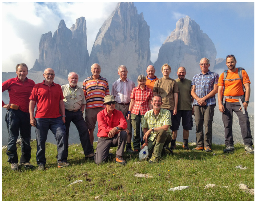
Vor den Drei Zinnen

G wie Gastfreundschaft: omnipräsent und grosszügig.