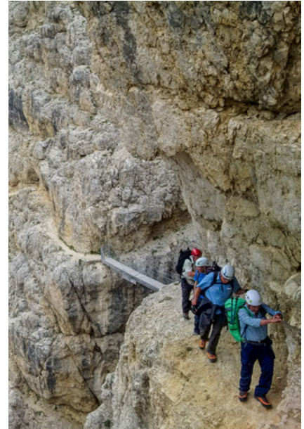
Aufstieg über den Kaiserjägersteig zum Lagazuoi

M wie Mobiltelefon: gern und häufig benutzt; im unter A beschriebenen Ereignisfall sogar entscheidend.