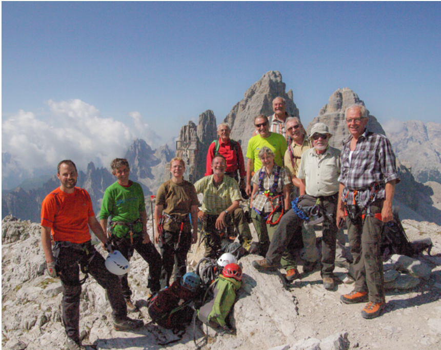
Auf dem Gipfel des Paternkofel

N wie Nasswand: österreichischer Soldatenfriedhof im Höhlensteintal. Ort der Besinnung.