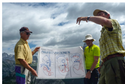
Gefechte auf dem Monte Piano